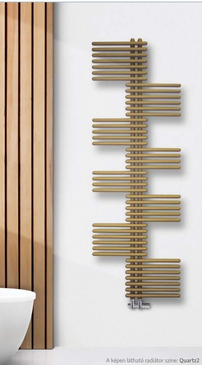
A képen látható radiátor színe: Quartz2

TISZTÁN ELEKTROMOS VÁLTOZATBAN IS ELÉRHETŐ