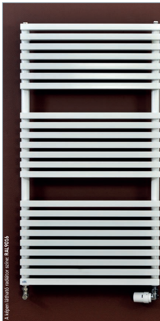
A képen látható radiátor színe: RAL 9016

ÜZEMI NYOMÁS 10 BAR - CSATLAKOZÁS 4DB G1/2" - 50MM-ES KÖZÉPCSATLAKOZÁSSAL IS RENDELHETŐ