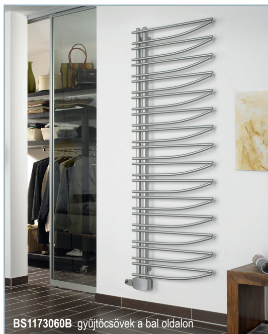
BS1173060B gyűjtőcsövek a bal oldalon

A BS.....B modellnél a gyűjtőcsövek a radiátor bal oldalán, a BS.....J modellnél a gyűjtőcsövek a radiátor jobb oldalán helyezkednek el.