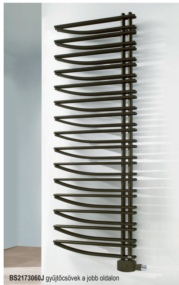
BS2173060J gyűjtőcsövek a jobb oldalon

ÜZEMI NYOMÁS: 10 BAR - CSATLAKOZÁS: 50MM G1/2" - JOBBOS VAGY BALOS KIALAKÍTÁS